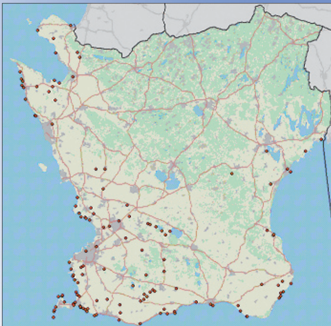
ÖVRE: FÖREKOMST JANUARI 2006-2008. NEDRE: JANUARI 2006.

Status 2008: Sparsam till sällsynt, men årsviss.